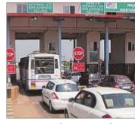
sionaire on the O&M and interest costs.

Also for the period when concessionaires were able to collect fees only partially, the concession period would be proportionately extended, the NHAI declared last week.